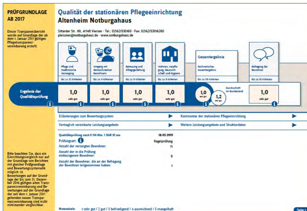
Abbildung: Ergebnis-Überblick über die vergangene MDK-Prüfung

Nachfolgend erhalten Sie einen kurzen Ergebnis-Überblick über die vergangene MDK-Prüfung in unserem Haus: