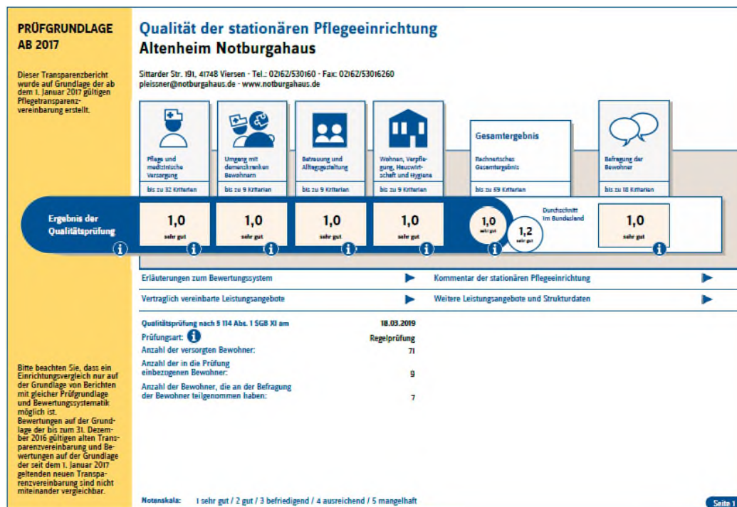
Abbildung: Ergebnis-Überblick über die vergangene MDK-Prüfung

Nachfolgend erhalten Sie einen kurzen Ergebnis-Überblick über die vergangene MDK-Prüfung in unserem Haus: